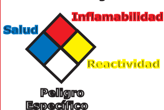
Figura 1. Sistema de Identificación para los Materiales Peligrosos

Se asignan números a los cuadros de colores azules, rojo y amarillo que denotan la gravedad del peligro para esa categoría. El grado de peligrosidad varía de 0-4, siendo el 4 = extremadamente peligroso y el 0 = no peligroso o peligro mínimo. En el cuadro de color blanco se escribe un símbolo específico o abreviación específica para describir el peligro.